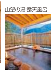
山望の湯:露天風呂