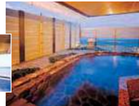
湖望の湯:露天風呂