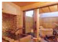
貸切露天風呂 石の音