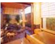
貸切露天風呂 木の香